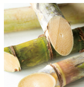
イネ科植物(サトウキビ、ソルガム等)

マツオの圧搾機では、様々な植物を搾ることが可能です。その他の原料についてもご相談ください。