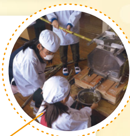
小学校の黒砂糖づくりの様子

地域のお祭りやイベント、会社のレクリエーションなどの福利的用途としてもご利用いただいております。